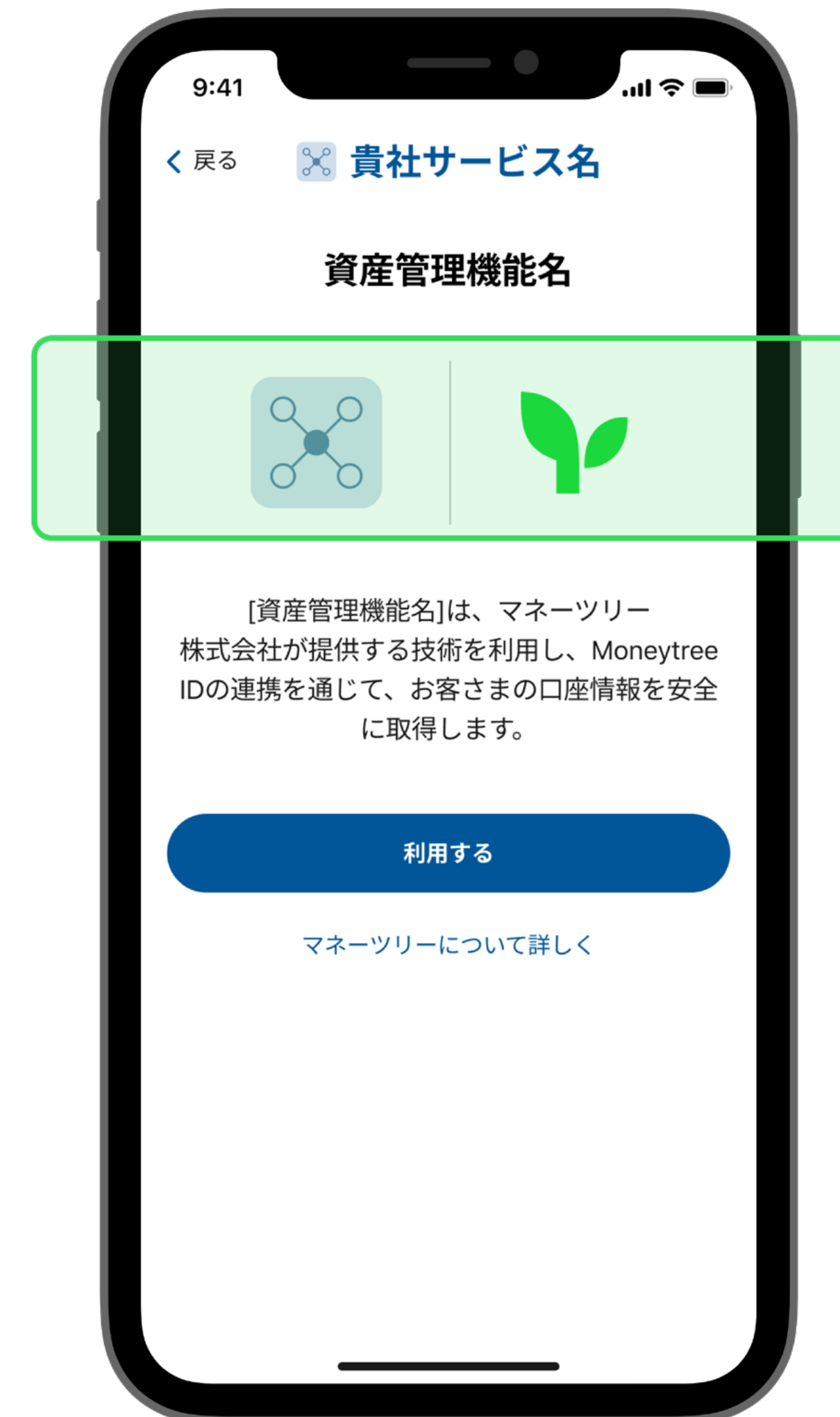
提携関係を示す両社のロゴ

※Moneytreeのロゴは、当社のブランドガイドラインに沿ってご使用ください。 (ブランドページは こちら )