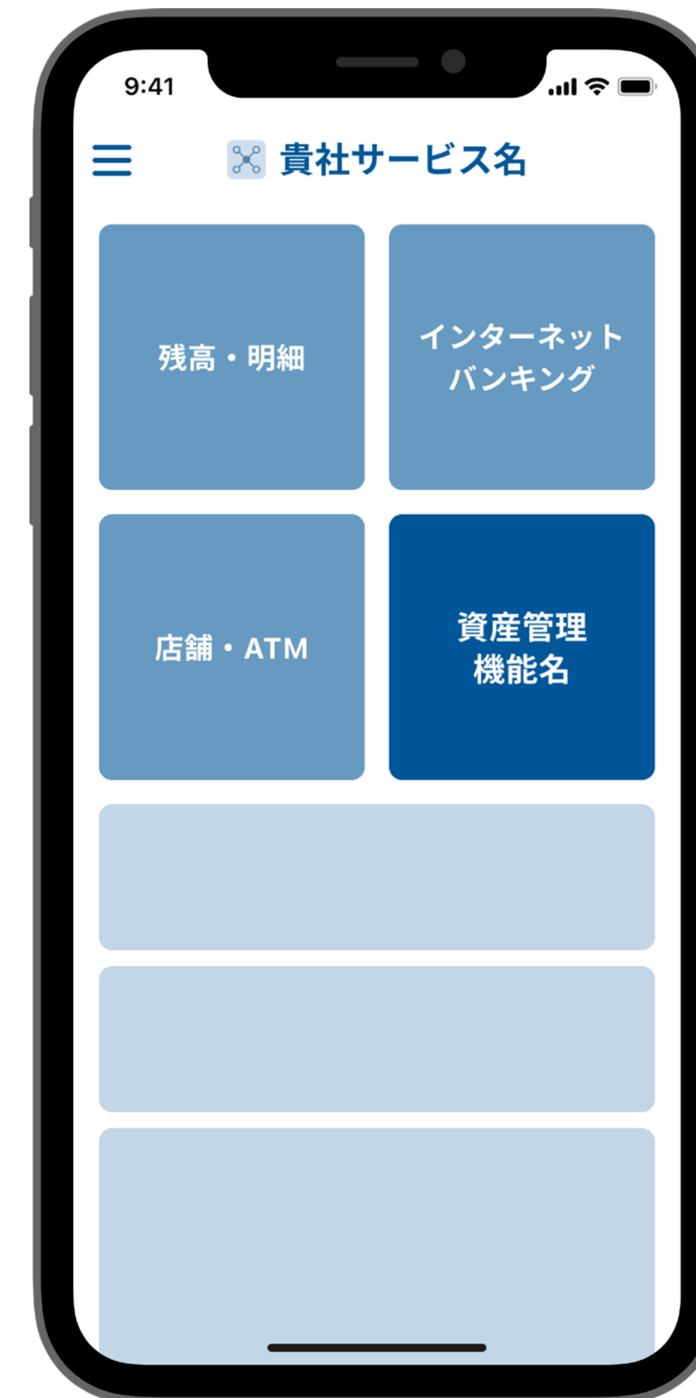
ナビゲーション画面の例