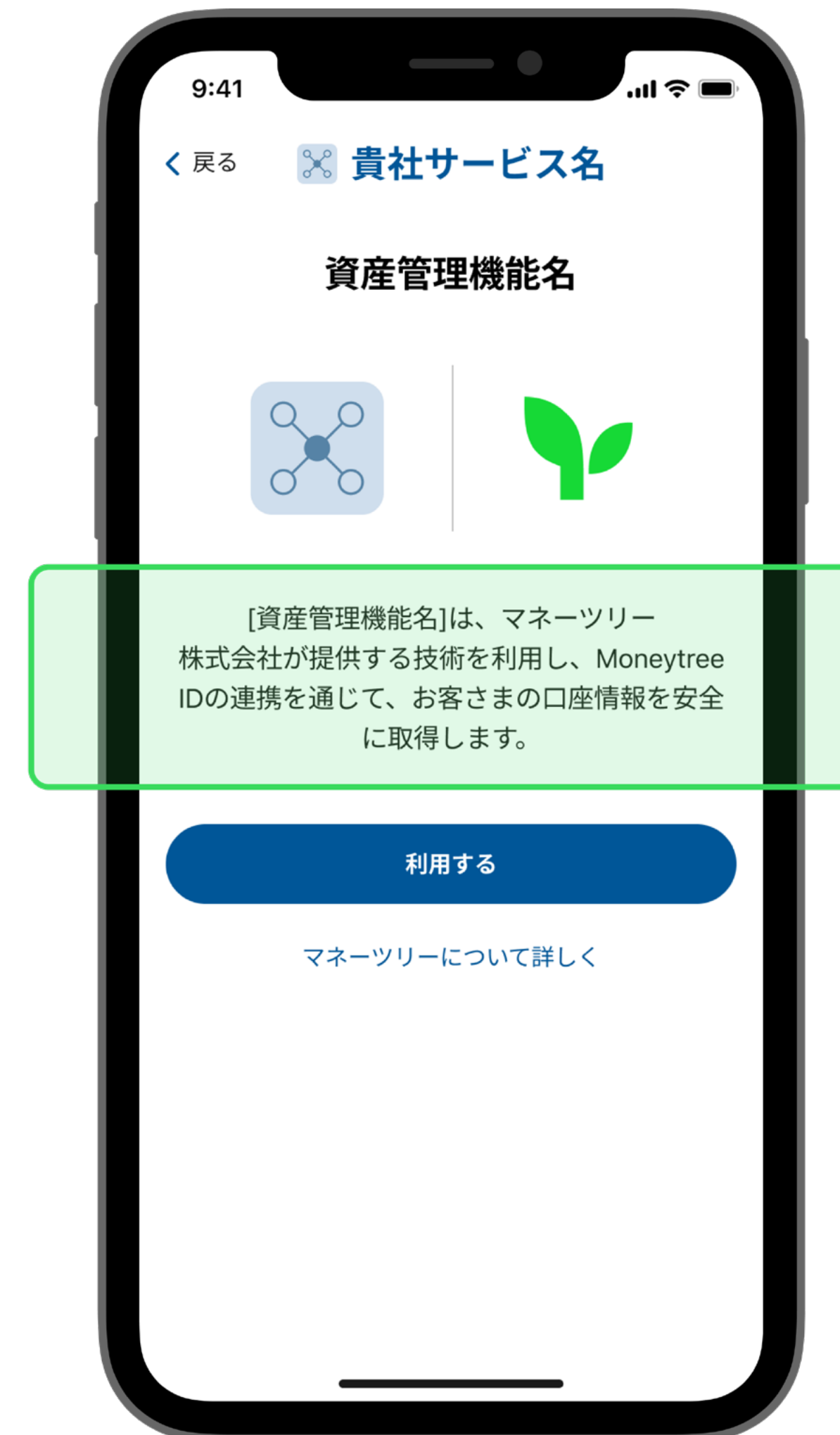
Moneytree IDの連携に関する説明文