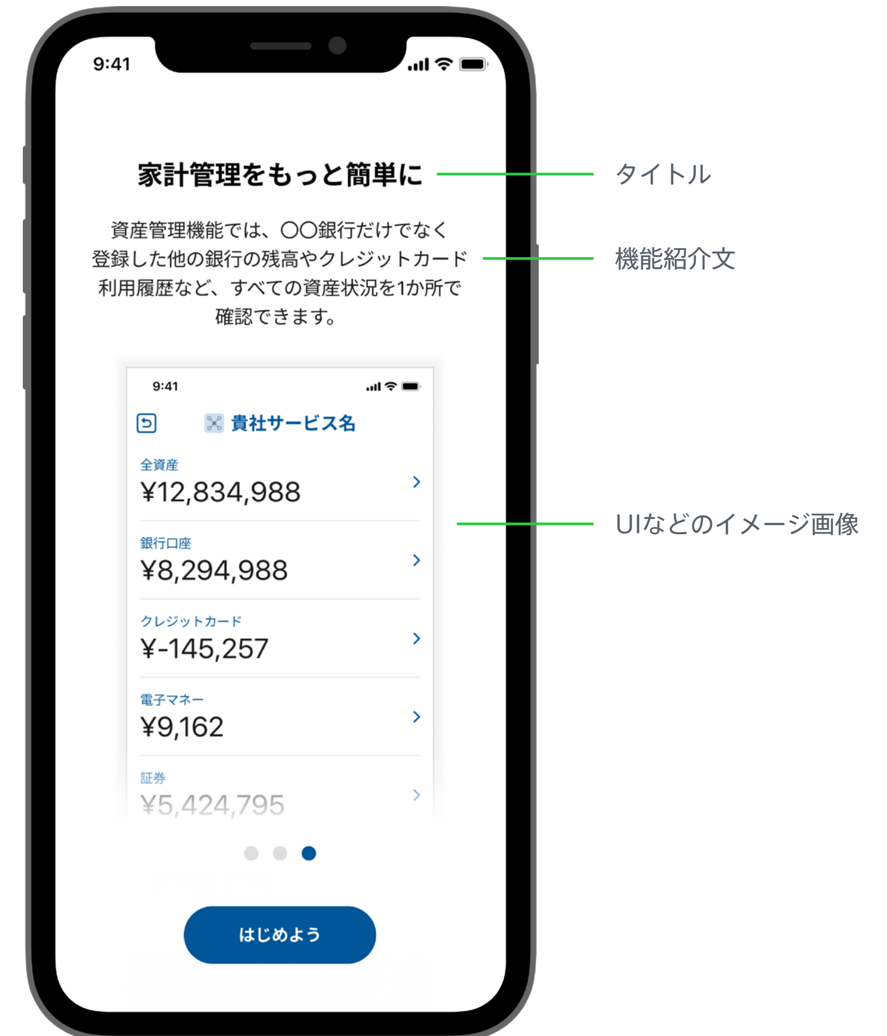
オンボーディング画面の例

全ての機能を紹介するのではなく、最も伝えたい機能に絞り、アプリやサービスの利用開始までのプロセスを短くして、利用者が得られるベネフィットを簡潔に説明することが望ましいです。